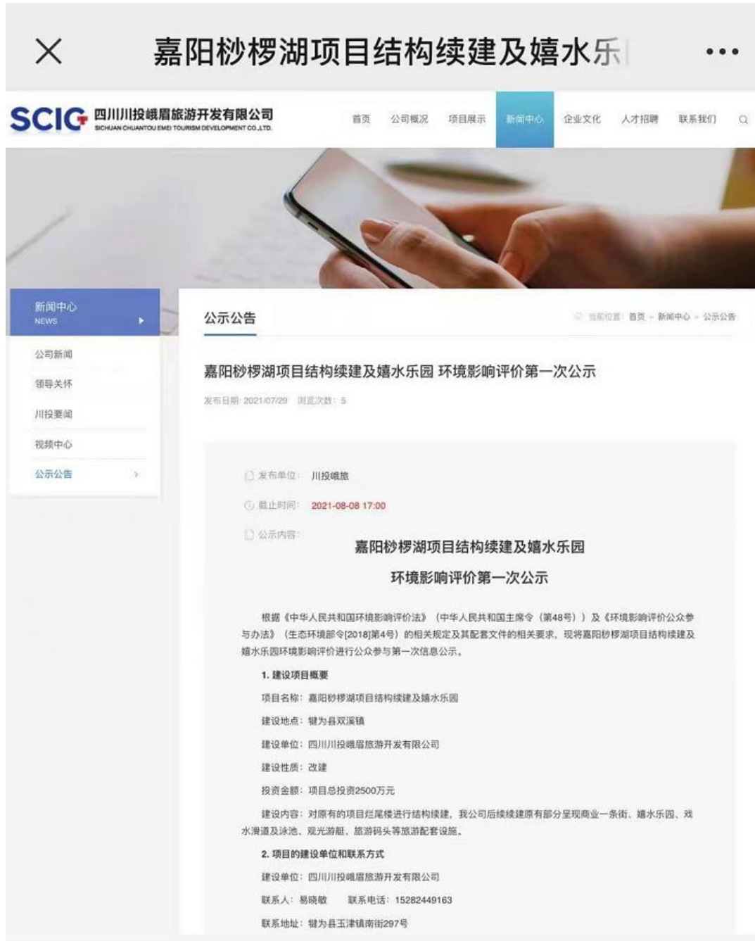
图 2.1-1 第一次环境影响评价信息公示网站部分截图