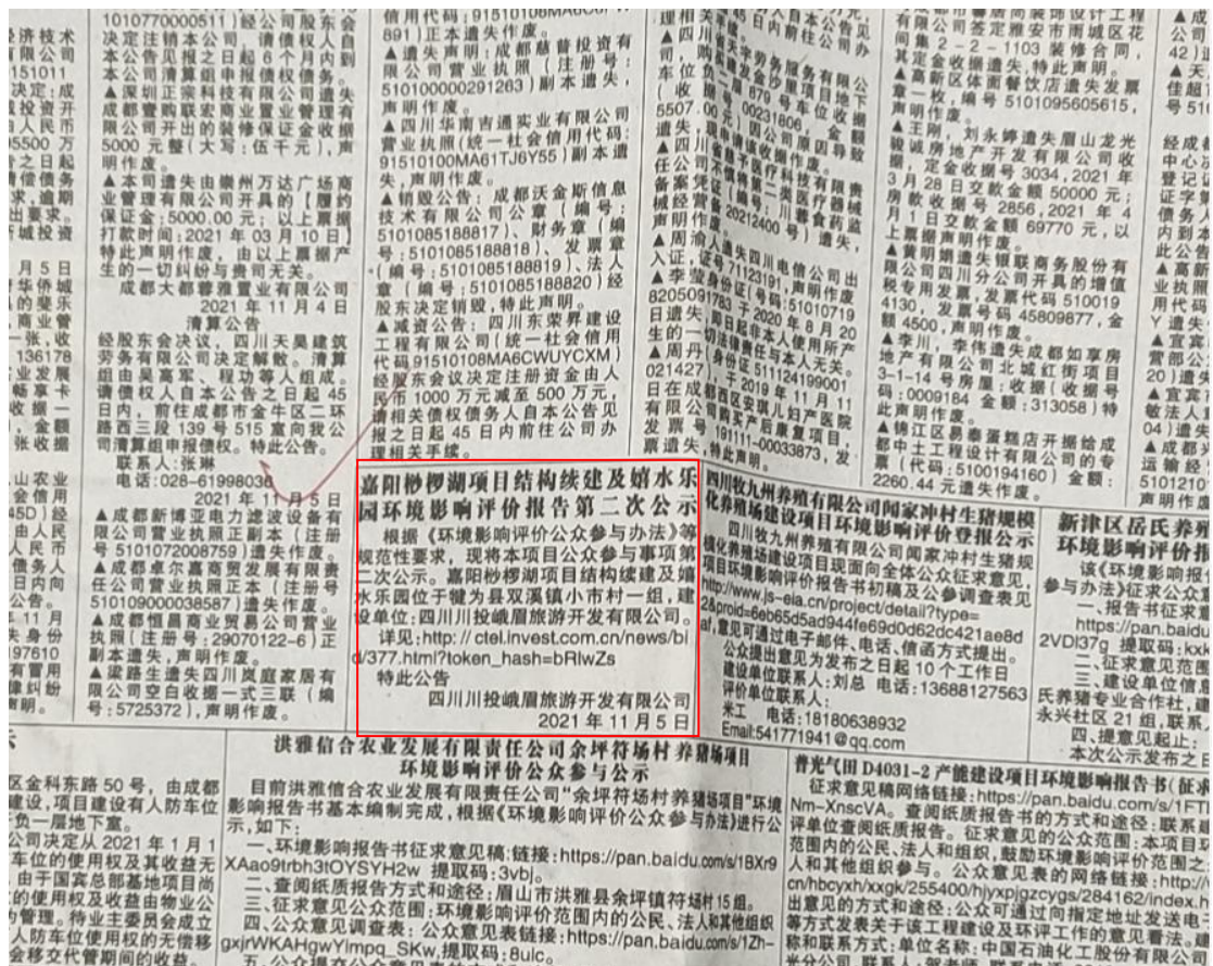
图 3.2-2 报纸第一次公示截图