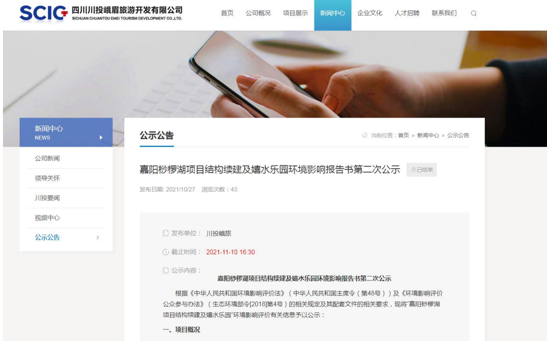
图 3.2-1 第二次环境影响评价信息公示网站部分截图