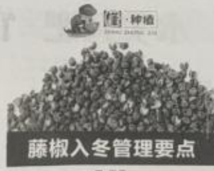
藤椒入冬管理要点

为农服务是农业高质量发展的基础。四川首设乡村植保员，旨在解决农村植保服务“最后一公里”问题，让农民在病虫害防治上不再“单打独斗”，而是有了“专业帮手”。 记者从省农业农村厅获悉，四川首设乡村植保员，是落实中央一号文件精神，深化农业供给侧结构性改革，提升农业质量效益和竞争力的重要举措。目前，全省已首批聘任了1000名乡村植保员，覆盖全省100多个县（市、区）。 乡村植保员的主要职责是：负责本村农作物病虫害的监测、预报、防治工作；开展农业技术培训，提高农民病虫害防治水平；协助乡镇农技推广站开展植保服务工作。 省农业农村厅表示，乡村植保员的聘任工作，将坚持公开、公平、公正的原则，通过公开招聘、择优录取的方式进行。聘任期满后，将根据工作表现进行考核，合格者续聘，不合格者解聘。