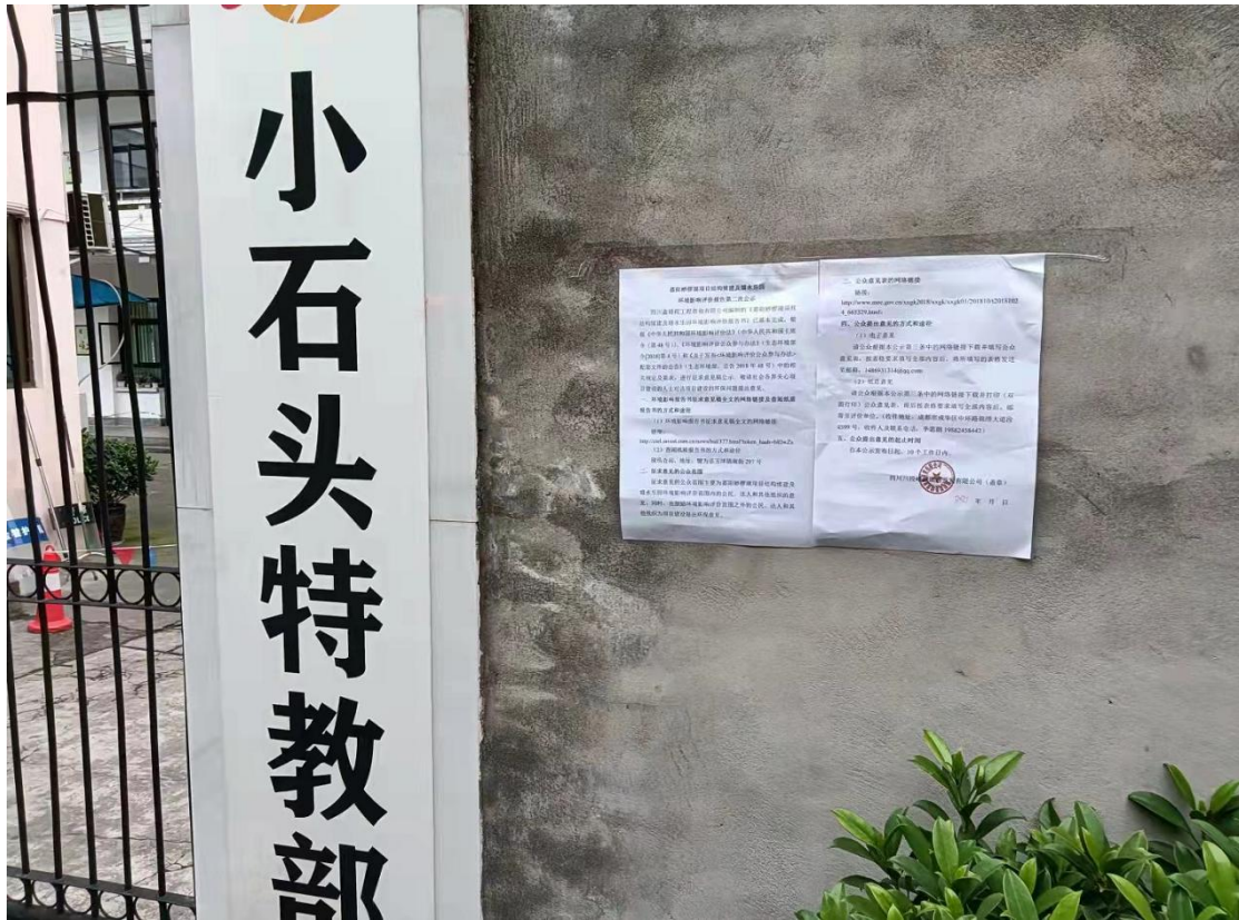
图 3.2.4 张贴公示